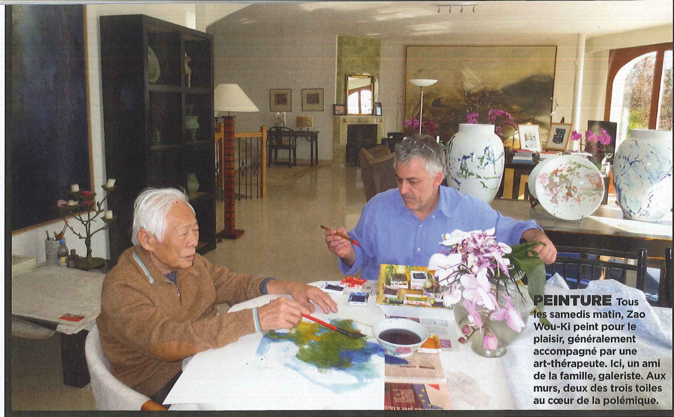
PEINTURE Tous les samedis matin, Zao Wou-Ki peint pour le plaisir, généralement accompagné par une art-thérapeute. Ici, un ami de la famille, galeriste. Aux murs, deux des trois toiles au cœur de la polémique.

huiles grand format ( Hommage à Chu-Yun, Hommage à Edgar Varèse, Hommage à Henri Matisse ), dont la valeur marchande se situerait entre